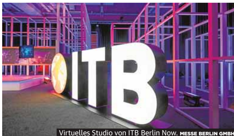
Virtuelles Studio von ITB Berlin Now. MESSE BERLIN GMBH

tens die Hälfte der Touristen aus dem Jahr vor der Pandemie anziehen zu können. Andalusien präsentiert sich als sichere Destination mit niedriger Corona-Inzidenz und einem breit gefächerten Urlaubsangebot. SEITE 3