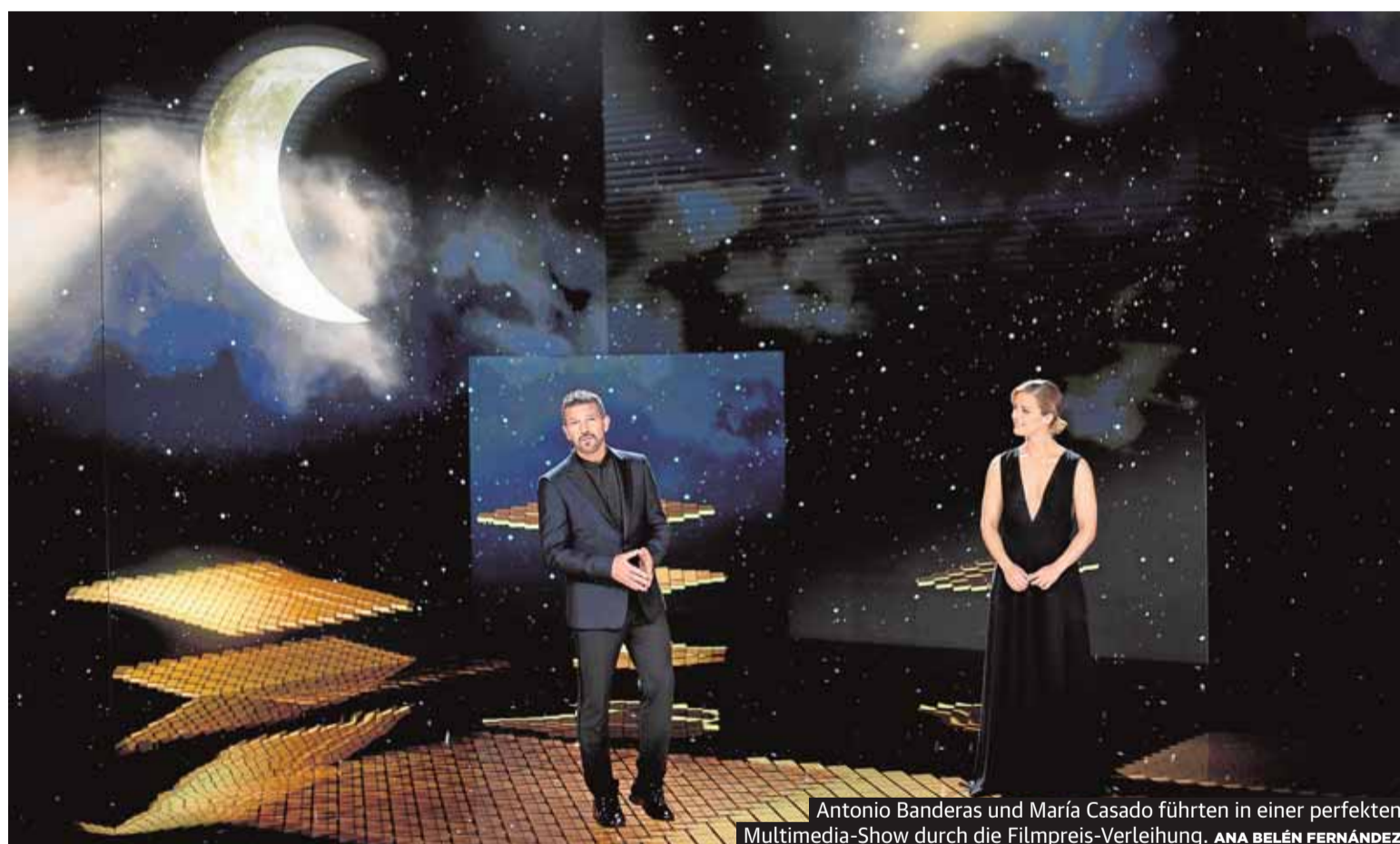
Antonio Banderas und María Casado führten in einer perfekten Multimedia-Show durch die Filmpreis-Verleihung. ANA BELÉN FERNÁNDEZ

über neue Lockerungen nachgedacht werden, so der Minister. Am Mittwoch einigten sich alle Ministerpräsidenten mit dem Gesundheitsministerium darauf, dass es über Ostern keine Reisefreiheit in Spanien geben wird. SEITE 2