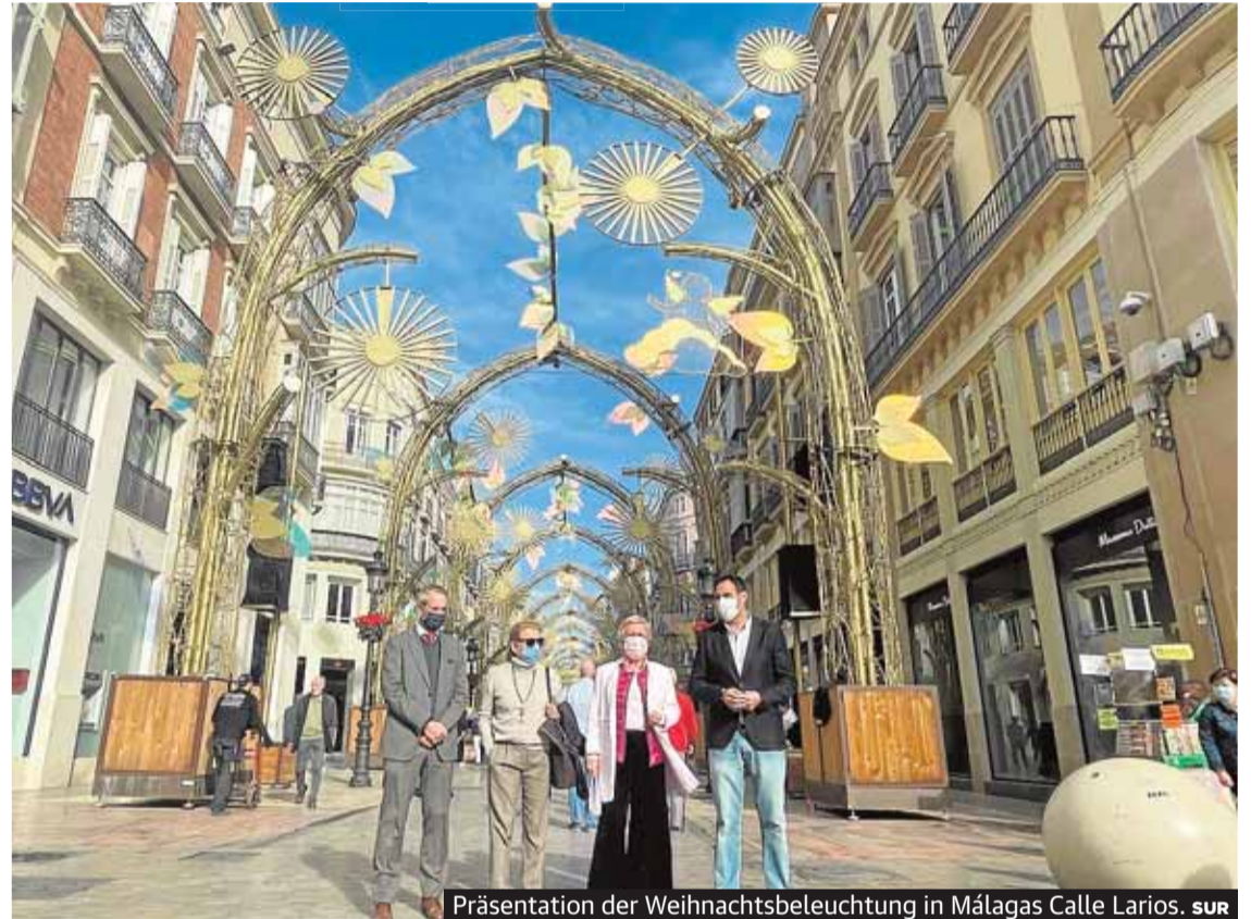
Präsentation der Weihnachtsbeleuchtung in Málagas Calle Larios. sur