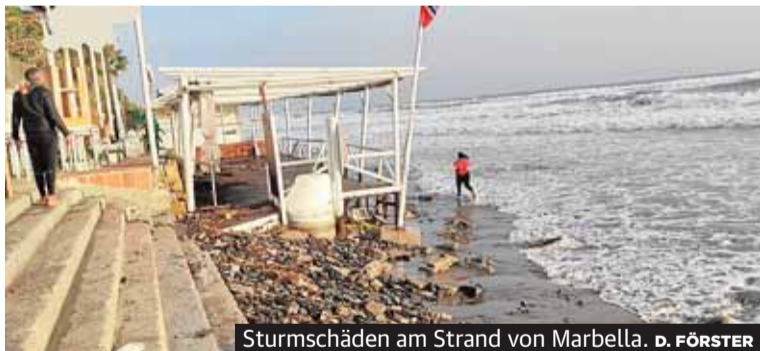
Sturmschäden am Strand von Marbella.

den bisher nie betroffene Stadtgebiete überflutet. Nach Ansicht von Meeresforschern wurde das Unwetter durch den Sturm verstärkt, steht aber auch in Zusammenhang mit dem globalen Klimawandel. SEITE 4