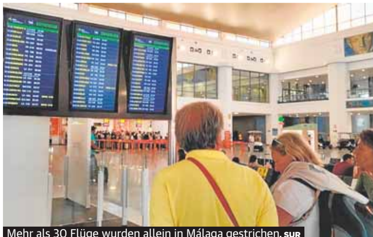
Mehr als 30 Flüge wurden allein in Málaga gestrichen.

Der Streik des Kabinenpersonals bei Ryanair hat am Wochenende zu zahlreichen Flugstornierungen am Flughafen Málaga geführt. Auch andere Flughäfen in Spanien waren betroffen. In den kommenden Tagen droht durch Arbeitskämpfe auch bei Easyjet und fehlendes Personal in ganz Europa zusätzliches Chaos. SEITE 3