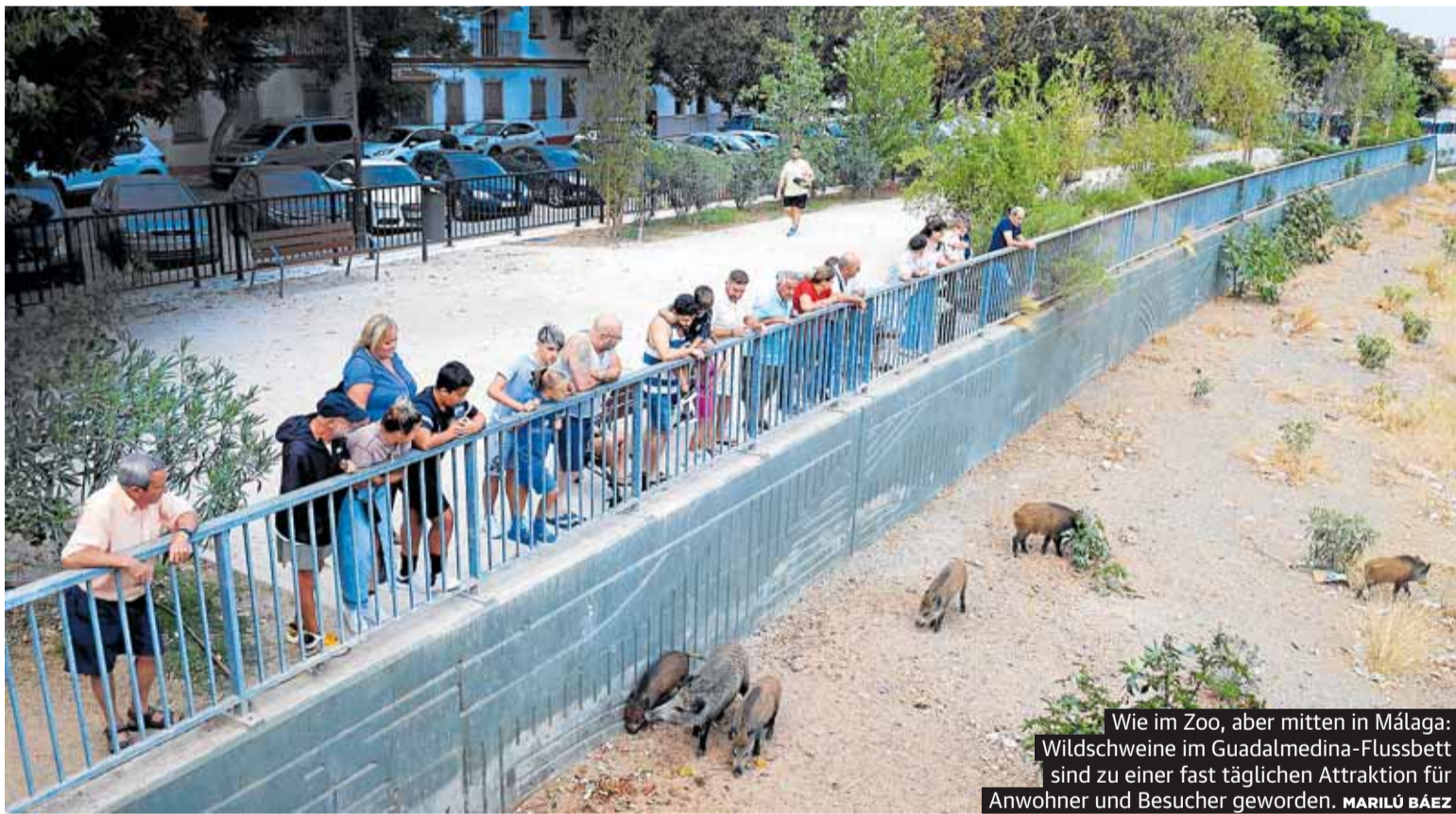
Wie im Zoo, aber mitten in Málaga: Wildschweine im Guadalmedina-Flussbett sind zu einer fast täglichen Attraktion für Anwohner und Besucher geworden. MARILÚ BÁEZ

die das Risiko von Krankheiten erhöhen. Gemeinden gehen mit unterschiedlichen Methoden ge- gen diese Invasion vor, die von Tierschützern häufig als Quälerei bezeichnet werden. SEITE 2